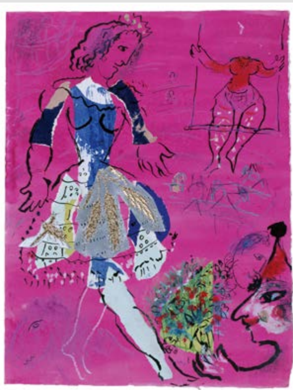
Marc Chagall TÄNZERIN VOR MALVENFARBIGEM HINTERGRUND Bildformat: 31,5 x 41,5 cm Blattformat: 48 x 60 cm 5-farbiger frequenzmodulierter Druck auf 250g Rives-Bütten Limitierte Auflage: 2.000 Exemplare © VG Bild-Kunst, Bonn 2013 € 98,-

Marc Chagall (1887–1985) in Witebsk/Weißrussland geboren, hat die Malerei des 20. Jahrhunderts geprägt wie kaum ein anderer. Seine Herkunft und die Aufenthalte in Paris und an der Côte d'Azur beeinflussten sein ganzes Werk. Geprägt von der Mystik seiner Kindheit und Jugend, spielen Szenen des bunten, bäuerlichen Lebens eine entscheidende Rolle: Tiere, Ställe, das turbulente Umfeld des Zirkus mit Jongleuren, Harlekinen und Artisten, und immer wieder Blumensträuße und Liebespaare, eingetaucht in starke, glühende Farben in einer phantastischen Zusammenfügung symbolischer Bildmotive.