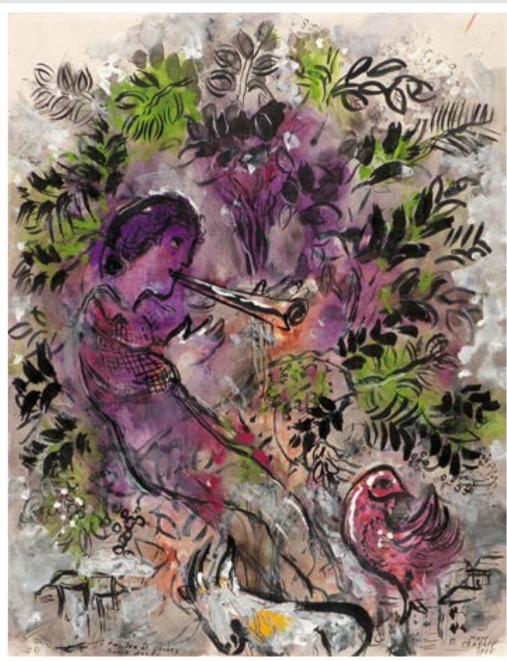
Marc Chagall DER JUNGE IN DEN BLUMEN, 1955 Bildformat: 43 x 55,5 cm Blattformat: 48 x 67 cm 5-farbiger frequenzmodulierter Druck auf 250g Rives-Bütten Limitierte Auflage: 2.000 Ex. VG Bild-Kunst, Bonn 2013 € 128,-

Die abgebildeten Reproduktionen sind in enger Zusammenarbeit mit den Museen und Sammlern entstanden. Damit zählen die DACO-Kunstdrucke in ihrer Qualität zu den besten weltweit.