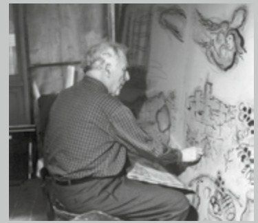
Marc Chagall in seinem Atelier in Paris.