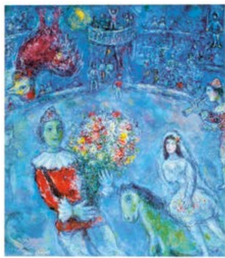
◀ Marc Chagall MUTTERSCHAFT, 1959 Bildformat: 45,5 x 50,5 cm Blattformat: 60 x 78 cm 8-farbiger Granolitho-Druck auf 270 g Rives-Bütten, Limitierte Auflage: 3000 Ex. © 1986, Copyright by A.D.A.G.P. & Cosmopress, Genf € 128,-